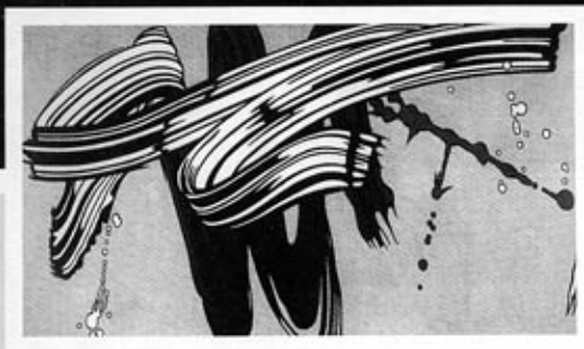
Fra højre mod venstre:

Roy Lichtenstein: Yellow and Green Brushstrokes , 1966.